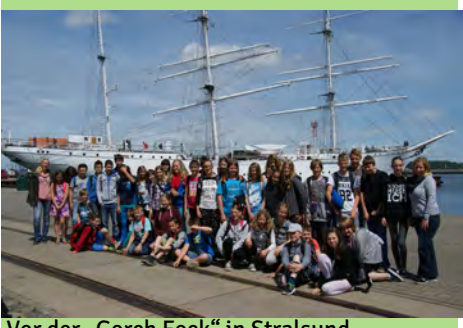
Vor der „Gorch Fock“ in Stralsund

Wir hatten wieder Post. Diesmal schickten uns die beiden 6. Klassen Eindrücke von ihrer Klassenfahrt. Danke!