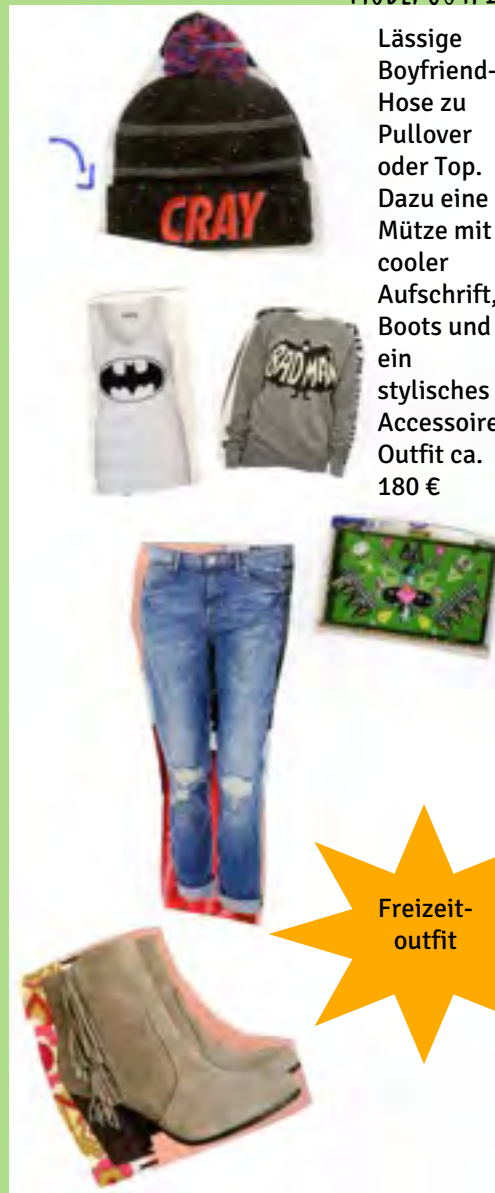
Outfits by: CHANTAL