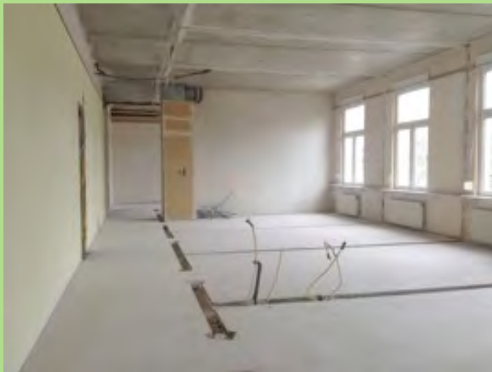
Baufreiheit im 1. OG in der GiG